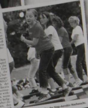
Konzentriert bei der Sache: der Step-Aerobic-Nachwuchs.